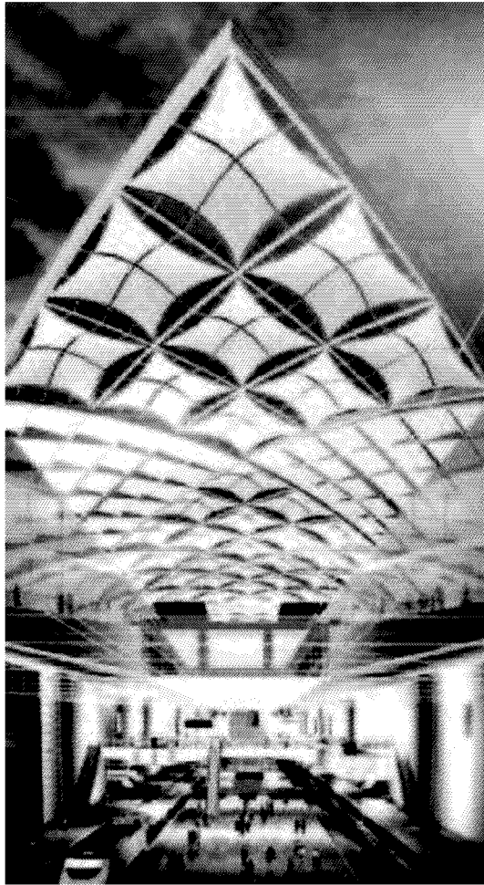
ALTA VELOCITA' La stazione Foster: il dibattito continua mentre i cantieri vanno avanti