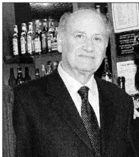
Giuseppe Del Carlo Capogruppo regionale dell'Udc